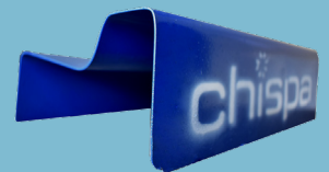
CARGADOR FRONTAL DE LEÑA